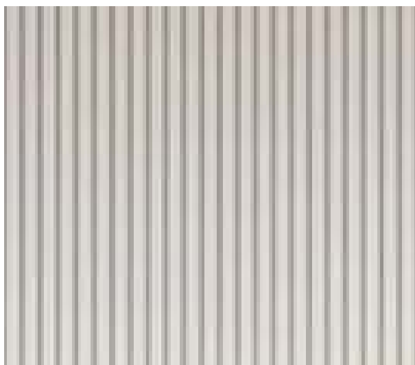
BLANCO ANDINO 15mm x 116.3mm x 2750mm