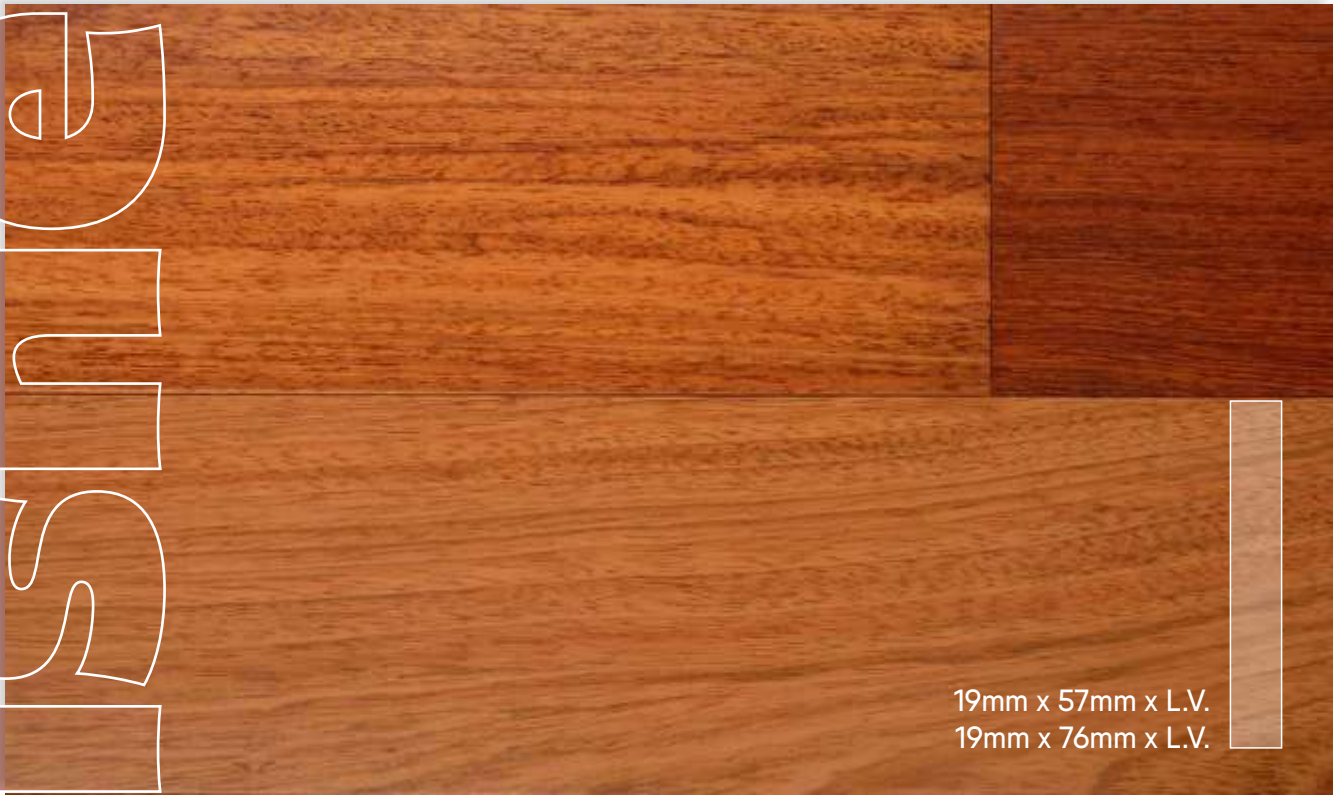
JATOVA Prefinished de Primera