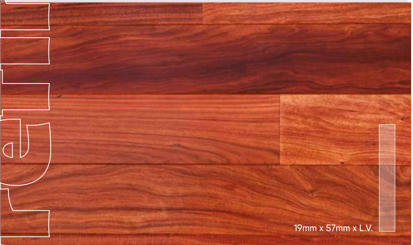
GUAYUBIRA Prefinished de Primera