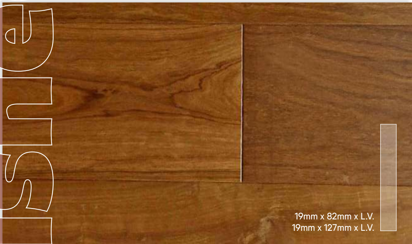
LAPACHO Prefinished Unica