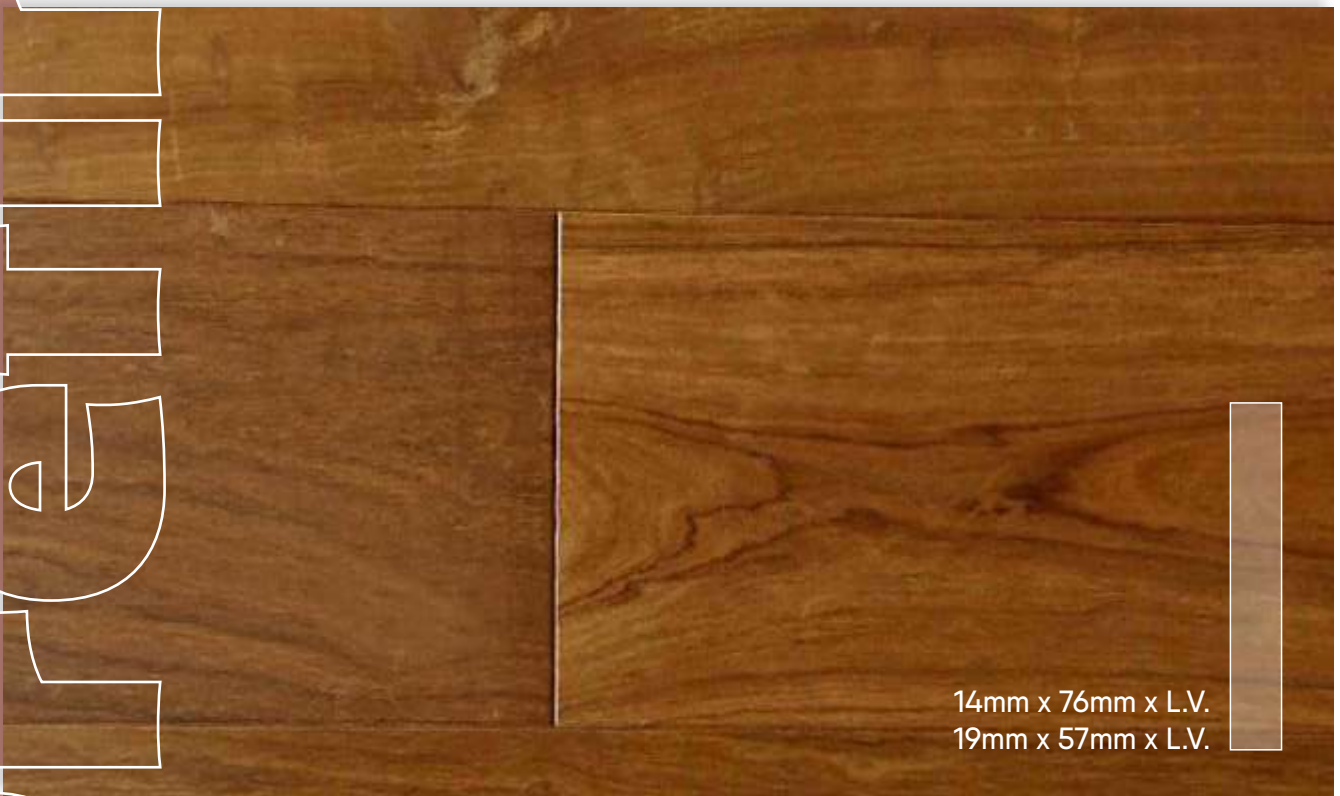
LAPACHO Prefinished de Primera