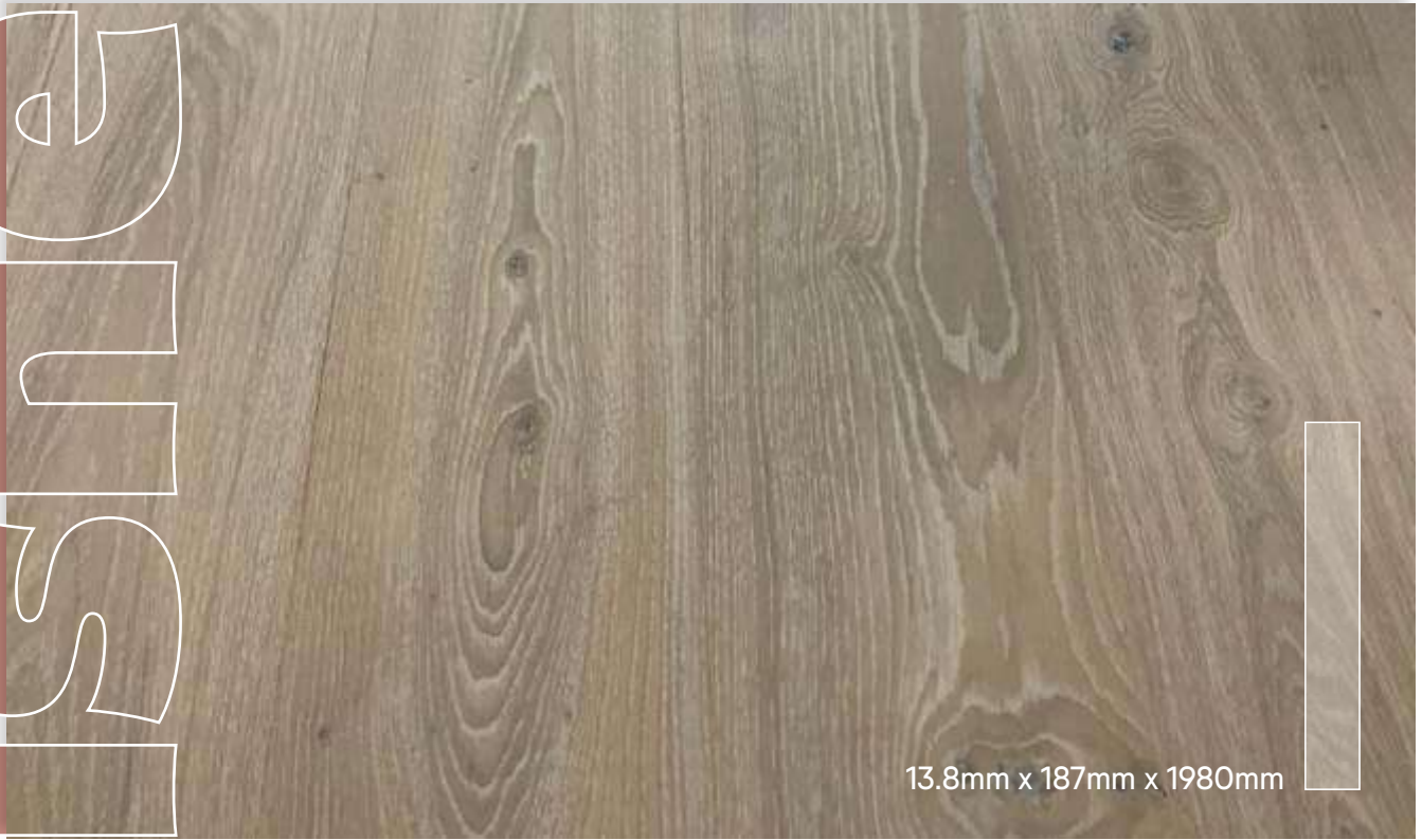
MONT BLANC Prefinished Oiled- Saga xl