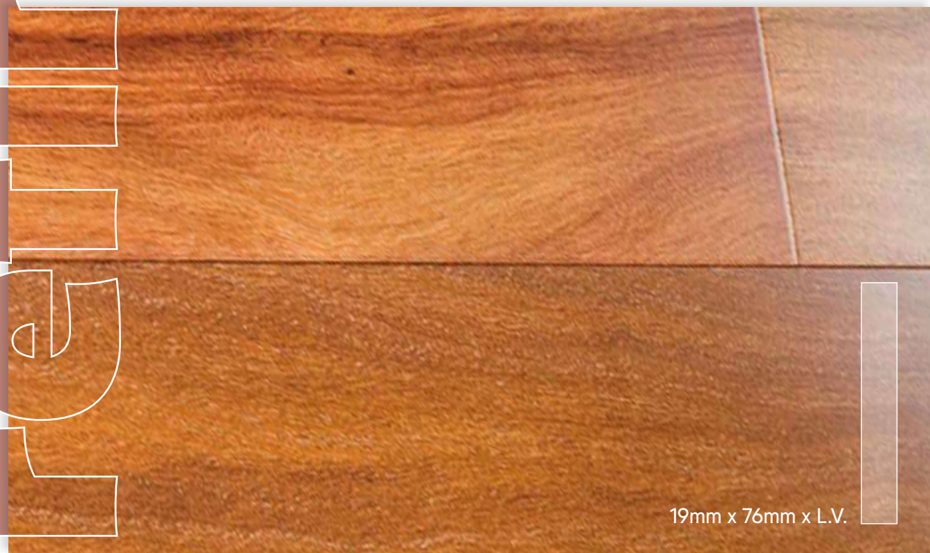
VIRARO Prefinished de Primera